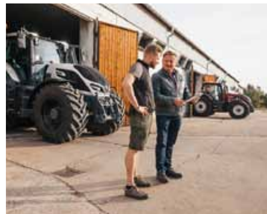
Q-seriens kunder garanteras speciellt bra service- och reservdelstjänster och annat stöd.

Syftet med alla egenskaper är ändå att för traktorns ägare producera ekonomiska inbesparingar