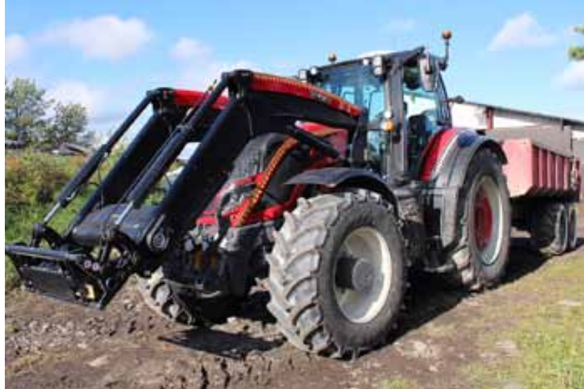
Markus Peräläs T195 Versu är den första av tio Pohojanmaa Erition-traktorer.

Markus Perälä studerade i yrkesskola till montör för tunga maskiner. Efter skolan arbetade han några år vid Ponsses lokala skogsmaskin-service och körde 1,5 år skogsma-